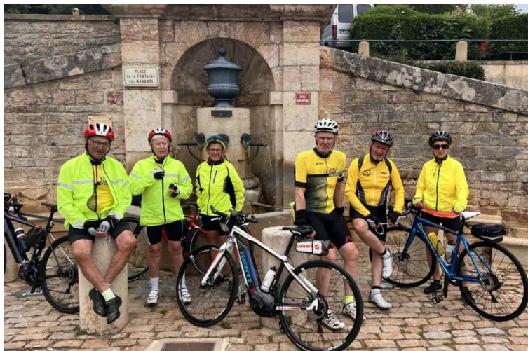
Cluny Le 23 mai, froid et couvert